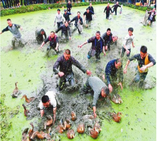
ଚୀନର ରୁଇଝେଓ ପ୍ରାନ୍ତର କିଆଙ୍ଗହୋଙ୍ଗନାନରେ ଏକ ପାରମ୍ପରିକ ଉତ୍ସବ କାଳରେ ଲୋକମାନେ ବତକ ଧରିବାରେ ଲାଗି ପଡ଼ିଛନ୍ତି ।