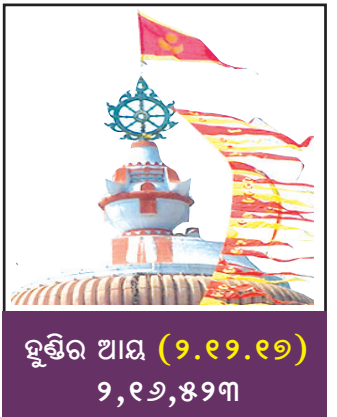
ହୁଣ୍ଡିର ଆୟ (୨.୧୨.୧୭) ୨,୧୬,୫୨୩