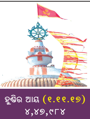
ହୁଣ୍ଡିର ଆୟ (୧.୧୧.୧୭) ୪,୪୭,୯୮୪