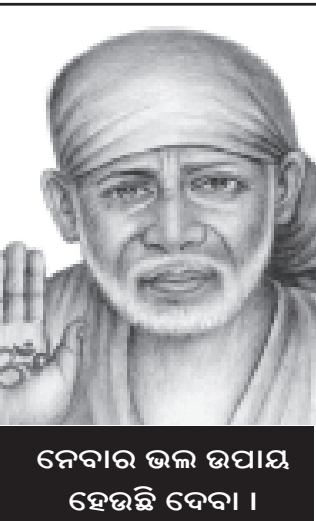
ନେବାର ଭଲ ଉପାୟ ହେଉଛି ବେବା ।

ଭୁବନେଶ୍ୱର, ୧୧୧୧ (ସକାଳ ଖବର) : କୋଲକାତାରୁ ପୁରୀ ଅଭିମୁଖେ ଚାପି ଯାତ୍ରାକୁ ଧରି ଆସୁଥିବା ଏକ ବସ କଟକର ଚାଙ୍ଗା ନିକଟରେ ଏକ ପିକ ଅପ କ୍ଷାମନକୁ ଧକ୍କା ଦେବାରୁ ୧୨ ଜଣରୁ ଉର୍ଦ୍ଧ୍ୱ ଆହତ ହୋଇଥିବା ଜଣା ପଡ଼ିଛି । ଏହି ଦୁର୍ଘଟଣାରେ ଆହତ ଲୋକ ମାନଙ୍କୁ ପୋଲିସ୍ ଛାନାନ୍ତର କୋଳକ ସହାୟତାରେ ଉଦ୍ଧାର କରି ଚାଙ୍ଗା ଡାକ୍ତରଖାନାରେ ଭର୍ତ୍ତି କରିଥିଲା । ସେଠାରେ କିଛି ଆହତଙ୍କ ସ୍ୱାସ୍ଥ୍ୟବସ୍ଥା (ସ୍ୱା-୭)