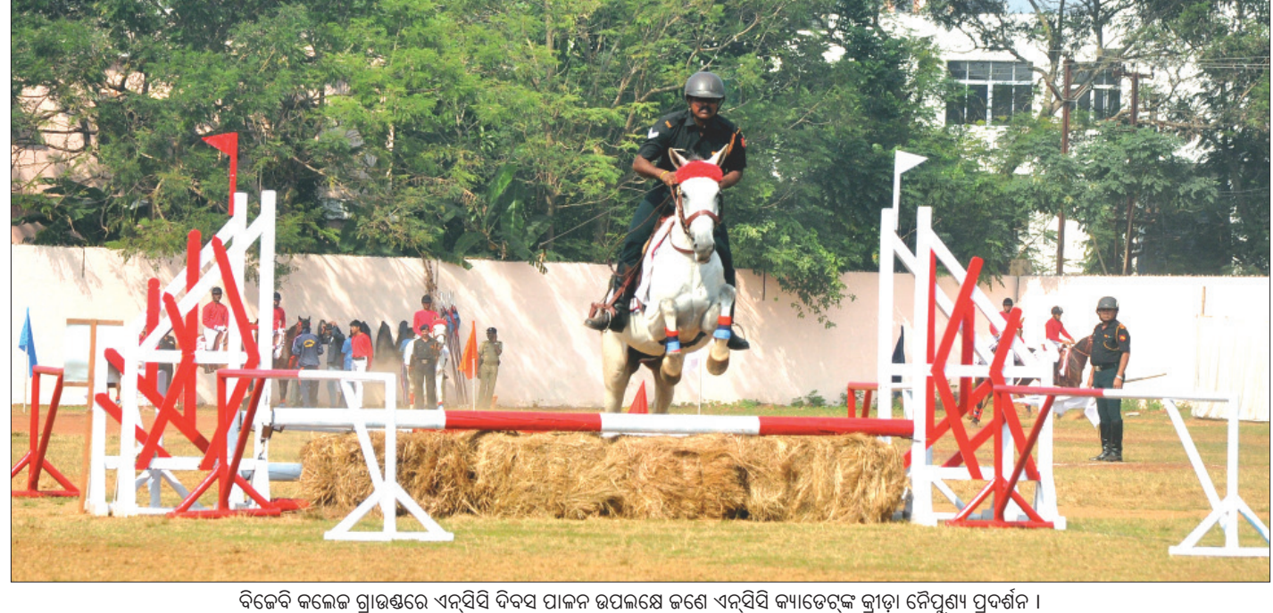
ବିଭେଦି କଲେକ୍ଟର ଗ୍ରାଉଣ୍ଡରେ ଏନସିସି ବିଏସ୍ ପାଳନ ଉପଲକ୍ଷେ ଜଣେ ଏନସିସି କ୍ୟାଡେଟ୍‌ଙ୍କୁ କ୍ୱାଡ୍ରା ନୈମ୍ନେଶ୍ୟ ପ୍ରଦର୍ଶନ।

ଆମେରିକାର ରାଷ୍ଟ୍ରପତି ଉବେନ(ହାଉସ୍ ହାଉସ୍)ର ପ୍ରେସ୍ ସଚିବ ସାରା ସାଣ୍ଡର୍ସ କା ରାଷ୍ଟ୍ରରେ ପାକିସ୍ତାନର ପଦକ୍ଷେପକୁ ସମାଲୋଚନା କରି କହିଛନ୍ତି ସେ ଏହାଦ୍ୱାରା ଆତଙ୍କବାଦୀ ଆତଙ୍କବାଦ ବିରୋଧରେ ଲିବା ପାଇଁ ପାକିସ୍ତାନର ଛଦ୍ମପ୍ରତିଷ୍ଠାକର୍ତ୍ତା ପଦରେ ପଡ଼ିଯାଇଛି। ଏଥି ସହିତ ପାକିସ୍ତାନ ଦାବି କରିବାକୁ ଆତଙ୍କବାଦ ବିରୋଧୀ ଅଭିଯାନ ମିଶ୍ର ବୋଲି ପୁଣି ପ୍ରମାଣିତ ହୋଇଛି। ତେଣୁ ପାକିସ୍ତାନ ଗମାଗମନ ସହ ନେଇ ପାକିସ୍ତାନ ଟୁରକ୍ ହାଫିଜ୍‌କୁ ସାରିଗିରଫ ସହ ଦଣ୍ଡ ଦେବାକୁ ସାହାଯ୍ୟ କରିବାକୁ ଅନୁରୋଧ କରିଛନ୍ତି। ଏହା ନକଲେ ଆମେରିକା ସହ ସମ୍ପର୍କରେ ତ ଛାଡ଼ା ଦିବ, ସାରା ବିଶ୍ୱରେ ମଧ୍ୟ ପାକିସ୍ତାନର ଭାବମୂର୍ତ୍ତି ଅତି ମତ୍ତରେ ବିଶ୍ୱସ୍ତ ହୋଇ ସେ ସଫଳ ହୋଇ ପାରେ।