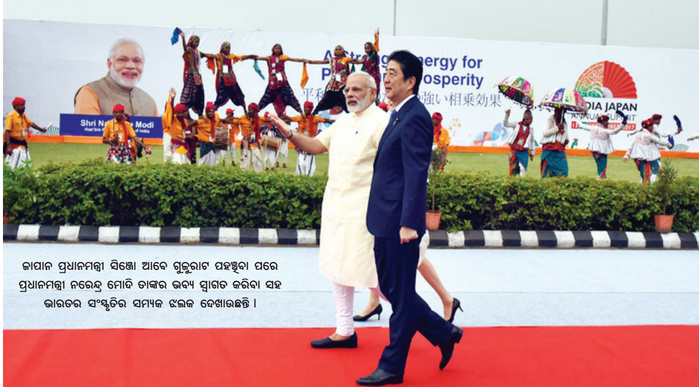
ଜାପାନ ପ୍ରଧାନମନ୍ତ୍ରୀ ସିଝୋ ଆଦେ ଗୁରୁବାର ପହଞ୍ଚିବା ପରେ ପ୍ରଧାନମନ୍ତ୍ରୀ ନରେନ୍ଦ୍ର ମୋଦି ତାଙ୍କର ଭବ୍ୟ ସ୍ୱାଗତ କରିବା ସହ ଭାରତର ସଂସ୍କୃତିର ସମ୍ୟକ ଝଲକ ଦେଖାଇଛନ୍ତି ।

ଦାଉଦ ସମ୍ପତ୍ତି ଜବତ ହେବାର ଖବର ପ୍ରକାଶ କରିଛି । ଜବତ ହୋଇଥିବା ସମ୍ପତ୍ତିର ମୂଲ୍ୟ ୪୨ ହଜାର କୋଟି ବୋଲି ସୂଚନା ମିଳିଛି । ଦାଉଦ ସମ୍ପତ୍ତି ଜବତ ହେବାର ଖବର ପ୍ରକାଶ କରିଛି । ଜବତ ହୋଇଥିବା ସମ୍ପତ୍ତିର ମୂଲ୍ୟ ୪୨ ହଜାର କୋଟି ବୋଲି ସୂଚନା ମିଳିଛି ।