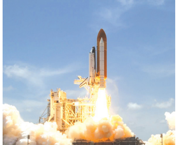
ଇତିହାସ ରଚିଲା ଉସ୍ତୋ, ପଠାଇଲା ୩୧ ଉପଗ୍ରହ ପାକିସ୍ତାନ ଓ ଚୀନ୍ ଉପରେ ନକର ରଖିବ

ନ୍ୟୁଆଦିଲ୍ଲୀ, : ଲସ୍ତୋର ପୋଲାର ସାମ୍ବନ୍ଧରେ ଲକ୍ଷ୍ମ କେଲକିଲ୍ (ପିଏସଏଲକି) ତାହାର ୪୨ତମ ଉଡ଼ାଣରେ ଏକକାଳୀନ ୩୧ଟି ଉପଗ୍ରହକୁ କକ୍ଷପଥରେ ଅବସ୍ଥାପିତ କରିବାରେ ସଫଳ ହୋଇଛି । ଏସବୁ ଉପଗ୍ରହ ମଧ୍ୟରେ ୨୧୦ କିଲୋଗ୍ରାମ ଓଜନର ଚିମୋଟ ସେନ୍ସିଂ କାର୍ଟୋସାଟ-୨ ଓ ଅନ୍ୟାନ୍ୟ ୩୦ଟି ଉପଗ୍ରହ ଅଛି ଶୁଆଝିନୋଗାର ସତ୍ୟା ଛାଡ଼ି ମହାକାଶ କେନ୍ଦ୍ରକୁ ଆଜି ଏହାର ଉଡ଼ାଣରେ ହୋଇଛି ପିଏସଏଲକିର ଏହି ଉଡ଼ାଣକୁ ପିଏସଏଲକି-୪୪୦ କୁହାଯାଉଛି । ମହାକାଶ କେନ୍ଦ୍ର ପ୍ରଥମ ଲକ୍ଷ୍ମ ପ୍ୟାଥରୁ ସକାଳ ୯ଟା ୨୯ ମିନିଟରେ ପିଏସଏଲକି ଉଡ଼ାଣ ଭବିଷ୍ୟାଳି । ଉଡ଼ାଣ ଆରମ୍ଭର ୧୨ ମିନିଟ ୩୩ ସେକେଣ୍ଡ ମଧ୍ୟରେ ଉପଗ୍ରହଗୁଡ଼ିକ ବିକ୍ଷୁବ ରେଖାର ୫୦୩ କିଲୋମିଟର ଓ ୯୭.୫୫ ଡିଗ୍ରୀ କକ୍ଷରେ ପହଞ୍ଚିପାରିଥିଲା । ଏହାପରେ ୭ ମିନିଟ ମଧ୍ୟରେ କାର୍ଟୋସାଟ- ୨ ସିରିଜ୍ ଉପଗ୍ରହ, ଆଇଏଏସଏ-୧୧ ଏଏଏ ଅନ୍ୟ ୨୮ଟି ଉପଗ୍ରହ ଗୋଟିଏ ପରେ ଗୋଟିଏ ପିଏସଏଲକିରୁ ବିଲ୍ଲିନ