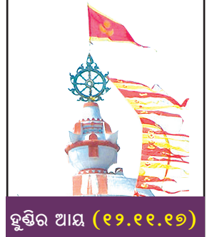
ହୃଦିକ ଆୟ (୧୨.୧୧.୧୭) ୪,୫୫,୦୨୭