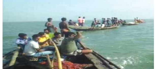
କୂହୁଡି ହୋଇ କାଳ, କୂଳରେ ଅଟକିଲା ଡଙ୍ଗା ଉଦ୍ଧାର ହେଲେ ଯାତ୍ରୀ, ସମସ୍ତେ ସୁରକ୍ଷିତ ରହିଥିଲା । ଡଙ୍ଗାରେ ୨୦ ଜଣ ଯାତ୍ରୀ ରହିଥିବାବେଳେ କୂହୁଡି କରିବା ପରେ ପୁଣି ଡଙ୍ଗାଟି ସାମାଜିକ ଭାବରେ ଉଦ୍ଧାର କରାଯାଇଛି । (ସ୍ଵା-୭)

ଭୁବନେଶ୍ୱର, ୧୨୧୧ (ସକାଳଖବର) : ଗତ କିଛି ଦିନ ହେବ ରାଜ୍ୟରେ ହାତ କଙ୍ଗା ଶୀତ କନକାଦନକୁ ଅପହ୍ୟନ୍ତ କରିଦେଇଛି । ଆଜି ରାଜଧାନୀ ଭୁବନେଶ୍ୱର ସମେତ ବିଭିନ୍ନ ସ୍ଥାନରେ ଘନକୂହୁଡି ଆବରଣ ଦେଖିବାକୁ ମିଳିଛି । ଘନ କୂହୁଡି ଯୋଗୁଁ ସାମାନ୍ୟତ ବାଧାପାସ୍ତ ହୋଇଥିବାବେଳେ ଚିଲିକାରେ ଏକ ସାଗ୍ରାବାସୀ ଡଙ୍ଗା ଫସି ରହିଥିଲା । ସୂଚନା ମିଳିଛି । ସମସ୍ତ ସାଗ୍ରାଙ୍କୁ ଅନ୍ୟ ଡଙ୍ଗା ଗୁଡ଼ିକ ଦ୍ୱାରା ଉଦ୍ଧାର କରାଯାଇଛି । ଆଜି ସକାଳେ ସାତପଡ଼ାରୁ କୁହୁଡିକୁ ଯାଉଥିବାବେଳେ ଚିଲିକା ମଧ୍ୟରେ ଏକ ବାଲିକୂଳରେ ସାଗ୍ରାବାସୀ ଡଙ୍ଗା ଅଟକି ରହିଥିଲା । ଘନକୂହୁଡି ଯୋଗୁଁ ଡଙ୍ଗାଟି ଆଗକୁ ଯିବା ସମ୍ଭବ ହୋଇ ପାରିନଥିଲା । ମଙ୍ଗଳା କୂଳ ନିକଟରେ ଡଙ୍ଗାଟି ଅଟକି