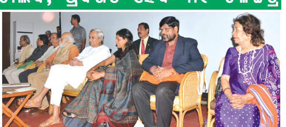
ଚଳଚ୍ଚିତ୍ର ପ୍ରଦର୍ଶିତ ହେବ । ବିଶିଷ୍ଟ କଥାକାର ମନୋଜ ଦାସ ଓ ଗୌରହରି ଦାସଙ୍କ ଲିଖିତ ସ୍ମୃତଗଗନ ଚଳଚ୍ଚିତ୍ର ମଧ୍ୟ ଦେଖିବାକୁ ମିଳିବ । ୧୧ ଦେଶର ୧୫ଟି ବିଦେଶୀ ଭାଷାର ସିନେମା ଦେଖିବାକୁ ମିଳିବ । ଏତଦ୍‌ବ୍ୟତୀତ ୧୨ଟି ଓଡ଼ିଶୀର ଏବଂ ୧୨ଟି ଅନ୍ୟ ଭାରତୀୟ ଭାଷାର ଚଳଚ୍ଚିତ୍ର ପ୍ରଦର୍ଶିତ ହେବ । ଅଧିକାରୀ ଉଦ୍‌ହାରିକ (ସ୍ଵା-୭)